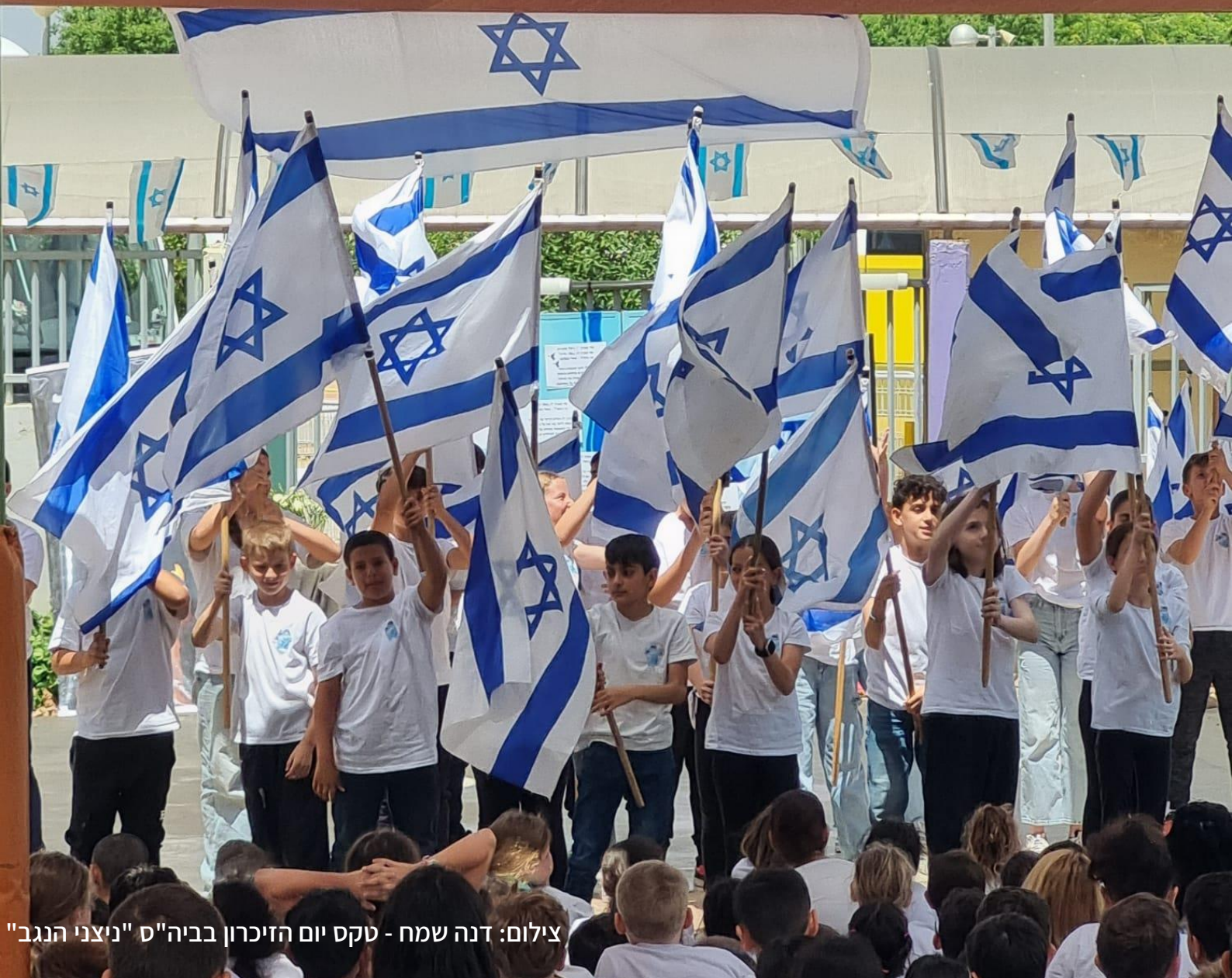
טקס יום הזיכרון בביה"ס "ניצני הנגב"

מועצה אזורית בני שמעון | צומת בית קמה | ד.נ. הנגב 8532400