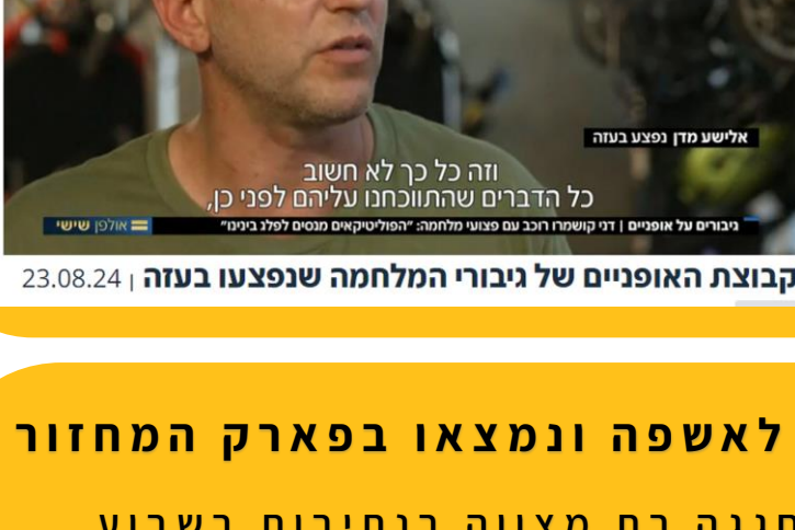
קבוצת האופניים של גיבורי המלחמה שנפצעו בעזה | 23.08.24